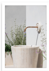
VELTHA OUTDOOR_ CURRENT Fontanella in travertino.JPG